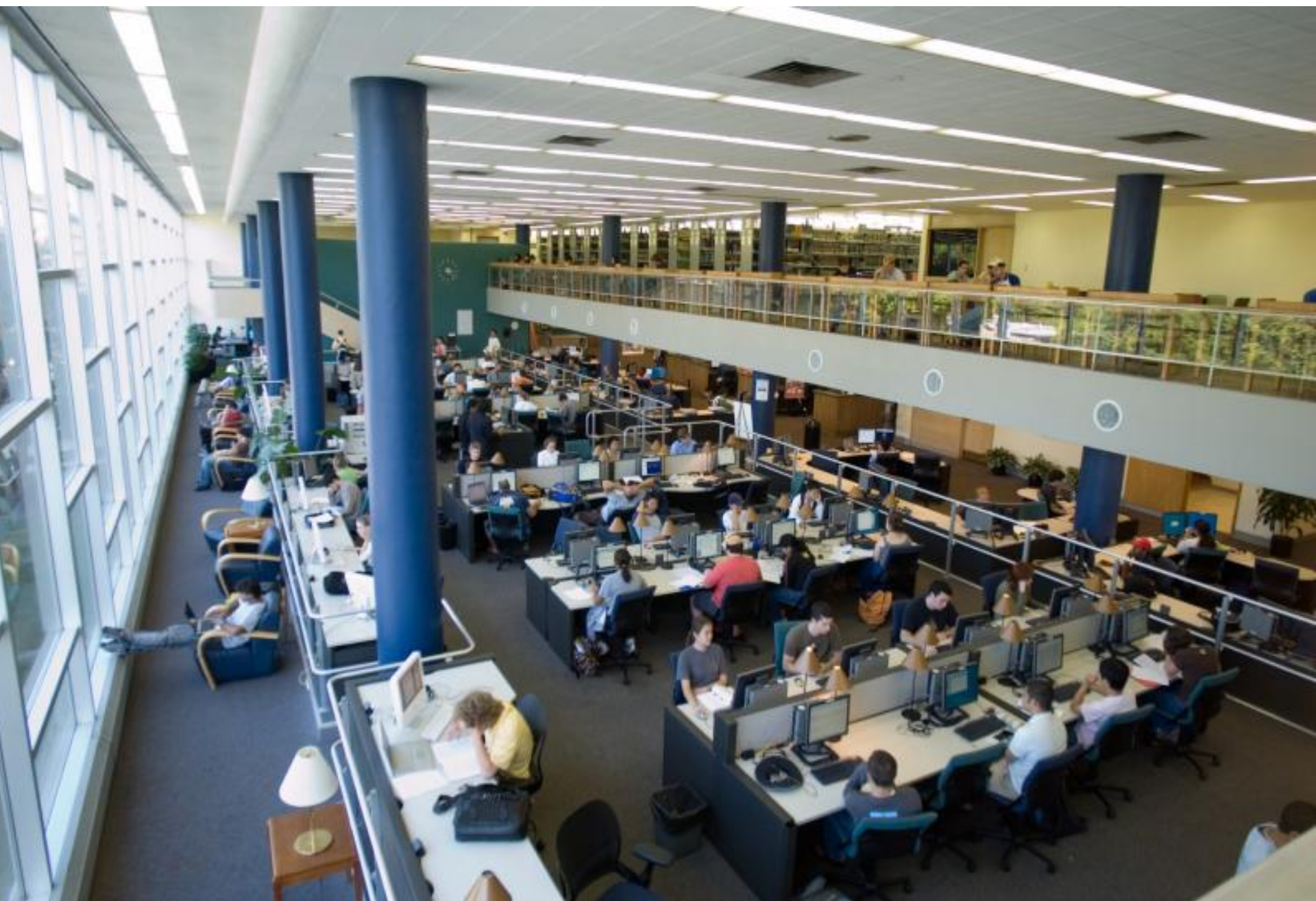
Jornada Nacional Bibliotecaria, Junio 2017